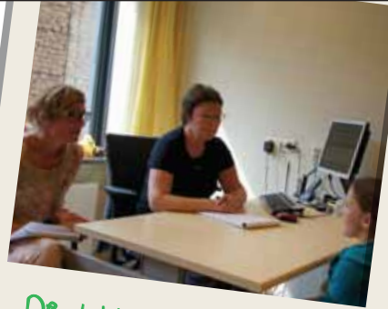
De dokter en psycholoog

Als je in Kempenhaeghe blijft slapen, ontmoet je op de opnameafdeling verpleegkundigen. Dan is er meestal één verpleegkundige die speciaal voor jou zorgt. Op de polikliniek werken epilepsieverpleegkundigen. De epilepsieverpleegkundige is iemand waar je naar toe kunt gaan als je bijvoorbeeld vragen hebt over je medicijnen of als je epilepsie hebt en je wilt weten wat er in je hoofd gebeurt als je een aanval hebt. Die kan je daar uitleg over geven.